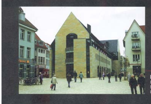
Lobende Erwähnung Huisdell & Halleger, Halberstadt Neubau des Halberstädter Rathauses und Re konstruktion der Westfassade

ne+tec statt. Ergänzt wird die Preisverleihung durch eine Potekten mit ihren Objekten in 25. Mal 2001 während des "Ar-STONEPus 2/2001 folgen hier chitekturForum Naturstein- im Naturstein-Architektur.