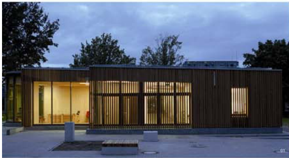
01 Front facade