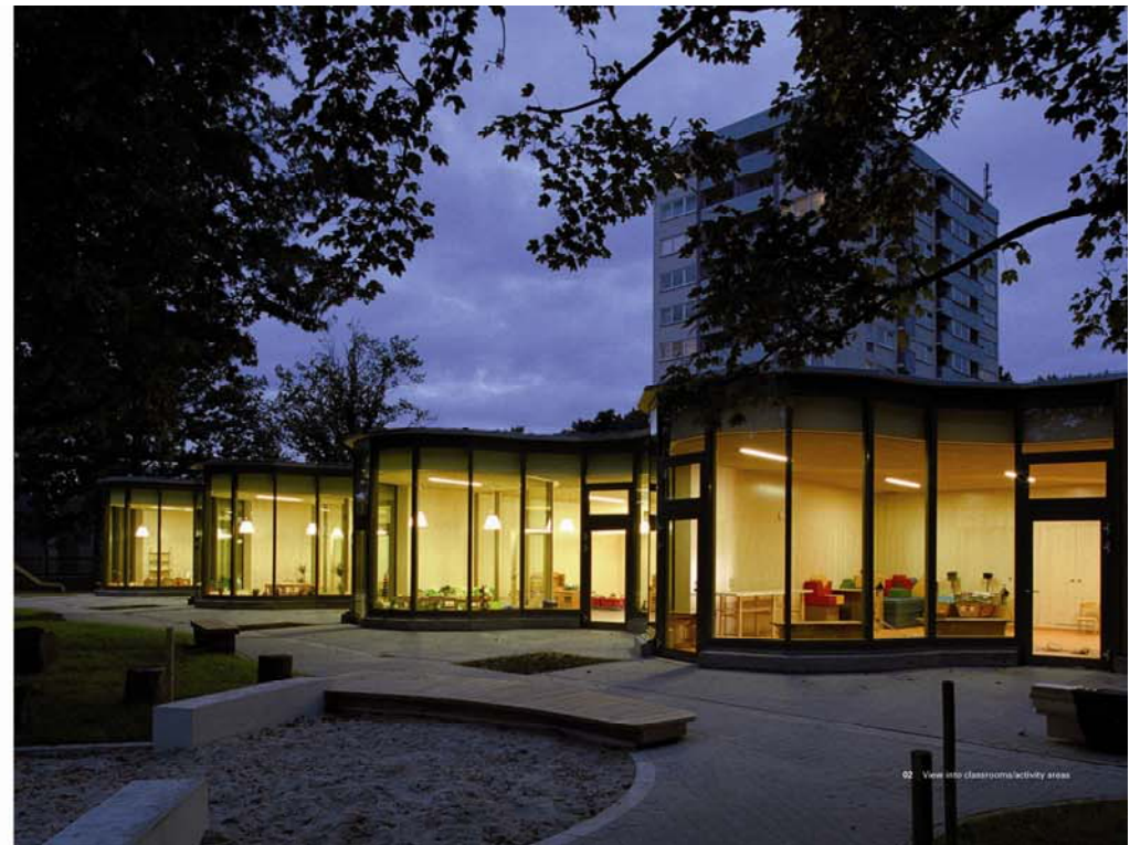
02 View into classrooms/activity areas

Project City Gross-Ilsede Typology Education Completion Year 2007