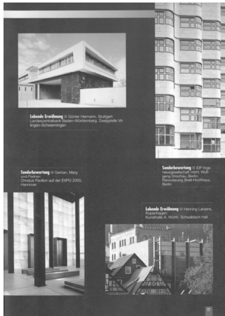
Additional award winner from Hannover EXPO church by GMP architects Hamburg / Germany