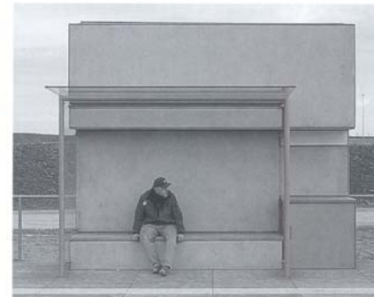
Beton pur am Haltepunkt Stockholmer Allee

Sie basieren alle auf dem gleichen Prinzip und doch hat jeder für sich einen ganz eigenen Charme: Den 13 Hochbahnsteigen der Bahntrasse zum EXPO-Gelände Hannover liegt ein durchgängiges, differenziertes Gestaltungskonzept zugrunde. Mindestens vier Wartekuben prägen einen Haltepunkt, schaffen ein Gegenüber und besetzen diesen Ort auf angenehme Weise. Sie bieten Schutz zur Fahrbahn und übernehmen auf eine selbstverständliche Art die Serviceeinrichtungen. Durch eine Vielfalt von Verkleidungen mit von Haltestelle zu Haltestelle unterschiedlichen Materialien werden die einzelnen Haltepunkte leitmotivisch individualisiert. Die Despang Architekten aus Hannover widmen sich mit besonderer Aufmerksamkeit einer Bauform, die gemeinhin wenig Beachtung findet: dem technischen Bauwerk aus dem Bereich Verkehrswesen, das in zunehmendem Maße das Stadtbild prägt.